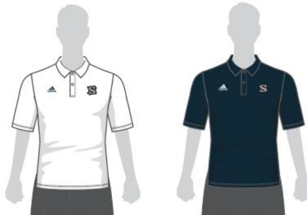
男女兼用、白または紺